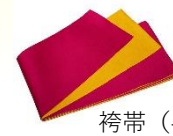
袴帯 (半幅帯・浴衣帯)